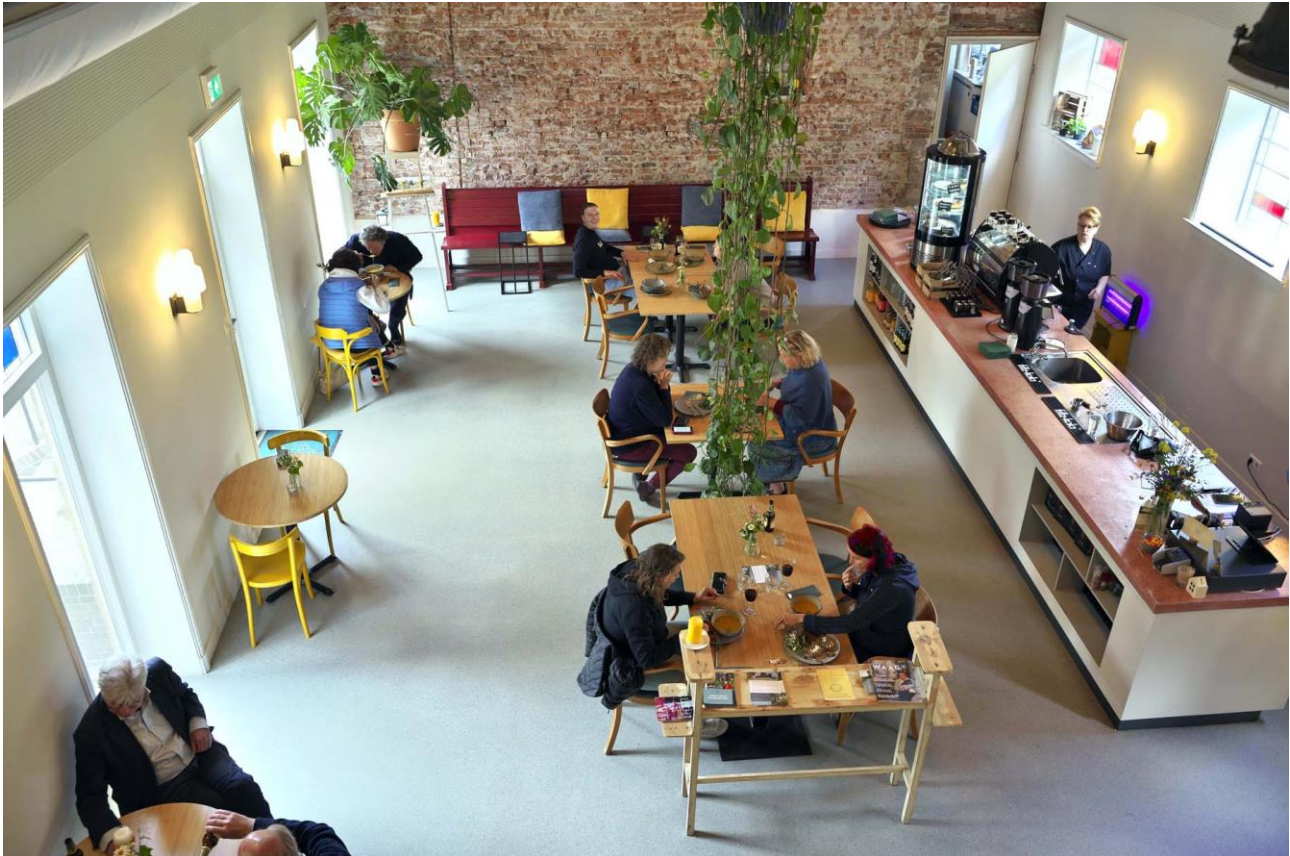
Het interieur van de voormalige buitenkapel, sinds Pinksteren 2021 de koffieschenkerij van Klooster Nieuw Sion

Zoals in iedere nieuwe bedrijfstak 'de kost voor de baat' uitgaat – zo is dat ook bij ons. Toch zijn we ervan overtuigd dat koffieschenkerij en kloosterboerderij-brouwerij op den duur zullen bijdragen aan een eigenstandige en winstgevende exploitatie van ons kloosterbedrijf. Op die manier kunnen we onze doelstelling van de instandhouding van ons cultureel en religieus erfgoed beter waarmaken.